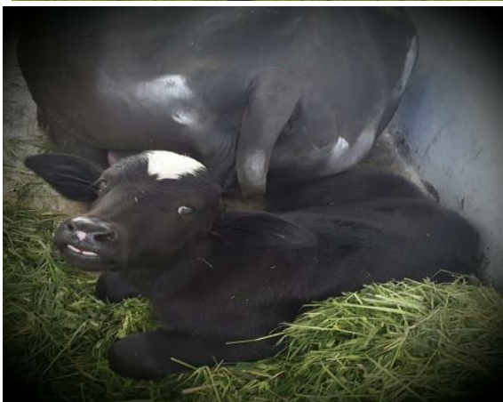
Gambar 2 : Gambar Kerbau Perah Sumatera Utara (jantan, betina dan anakan)